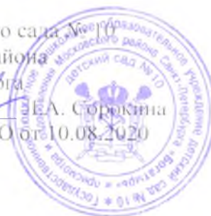
График проведения обработки помещений и контактных поверхностей с применением дезинфицирующих средств после каждого посещения отдельной группой лиц музыкального зала, физкультурного зала, кабинета логопеда, кабинета психолога, кабинета массажиста в государственном бюджетном дошкольном образовательном учреждении детском саду № 10 Московского района Санкт-Петербурга «Богатырь»

Е.А. Сорокина Приказ № 14/2-О от 10.08.2020