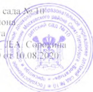
График организации питьевого режима в государственном бюджетном дошкольном образовательном учреждении детском саду № 10 Московского района Санкт-Петербурга «Богатырь»

Е.А. Сорокина Е.А. Сорокина Приказ № 14/2-О от 10.08.2020